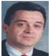
Tomica Milosavljević – G17Plus