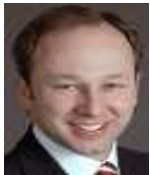
Slobodan Milosavljević – G17Plus