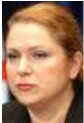
Jasna Matić – G17Plus

minister telekomunikácií a informačnej spoločnosti