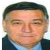
Milutin Mrkonjić – SPS