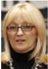
Verica Kalanović – G17Plus

minister telekomunikácií a informačnej spoločnosti