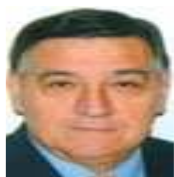
Milutin Mrkonjić – SPS