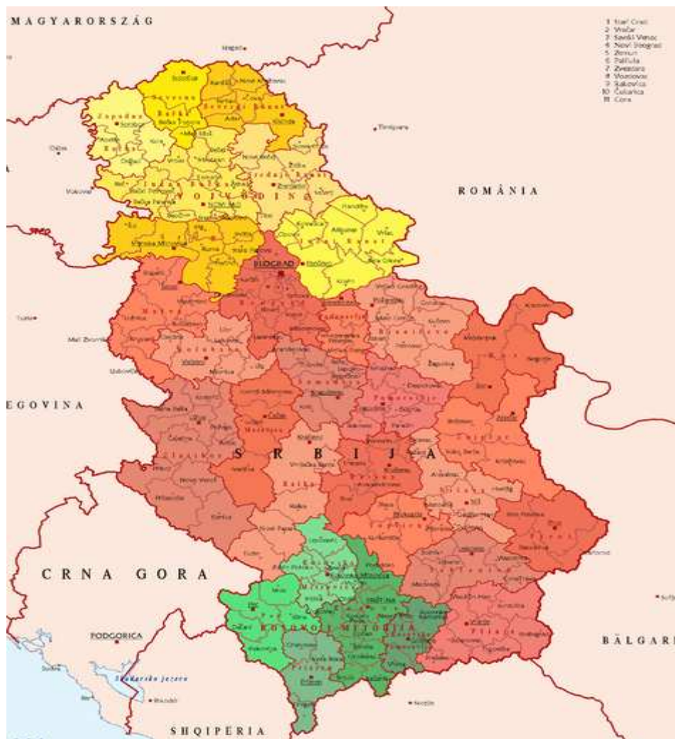
mapa Administratívneho rozdelenia Srbska podľa zákona z roku 1992

Obvod Gjakova (Đakovický obvod) Obvod Gjilan (Gnjilanský obvod) Obvod Mitrovica (Kosovskomitrovický obvod) Obvod Peja (Pečský obvod) Obvod Prishtinë (Prištinský obvod) Obvod Prizreni (Prizrenský obvod) Obvod Ferizaji (Uroševacký obvod)