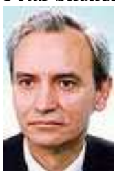
Petar Škundrić – SPS

minister pre štátnu správu a miestnu samosprávu